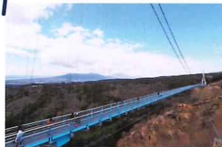
三島スカイウォーク