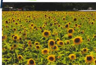
袋井市のひまわり畑