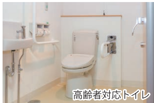
高齢者対応トイレ