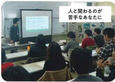
コミュニケーション講座