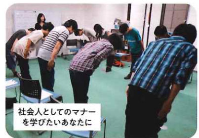
ビジネスマナー講座