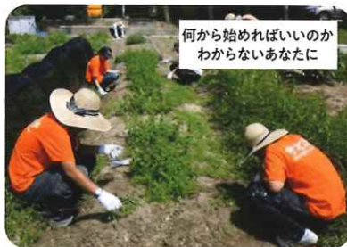
集中訓練プログラム