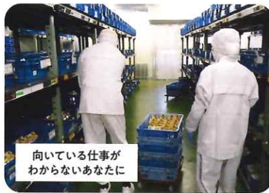
ジョブトレーニング