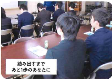
就活セミナー (面接・履歴書指導など)