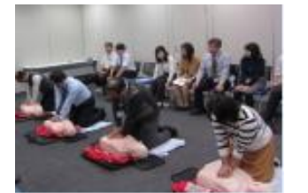
救命講習・応急救護実技訓練