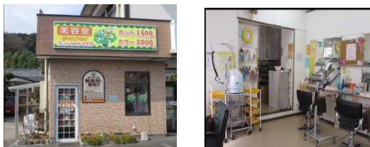
ビーズ・アイ菫山店