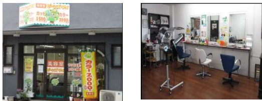
ビーズ・アイ沼津店