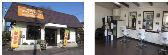
プラスワン 大岡店