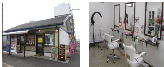
アプリシエイト 花園店