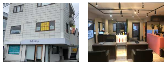
アプリシエイト 竹原店