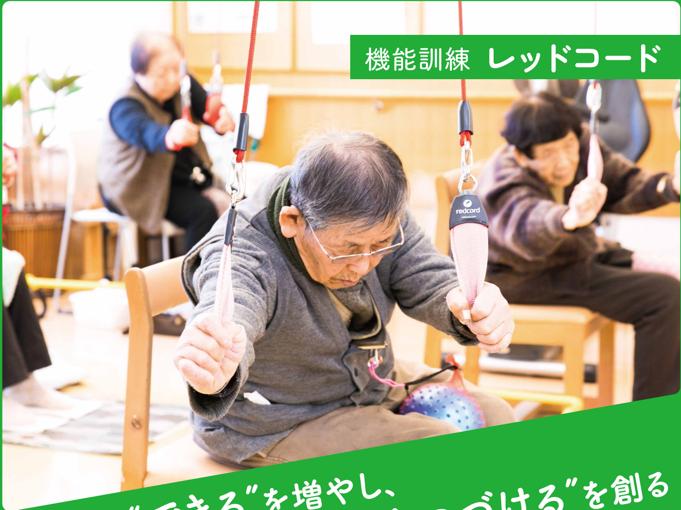
機能訓練 レッドコード