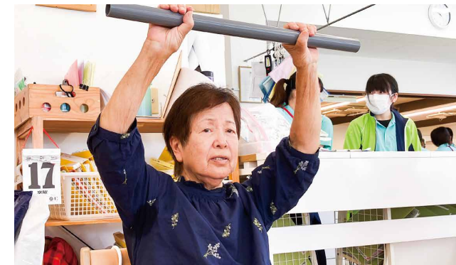
80代・女性 利用者Tさん