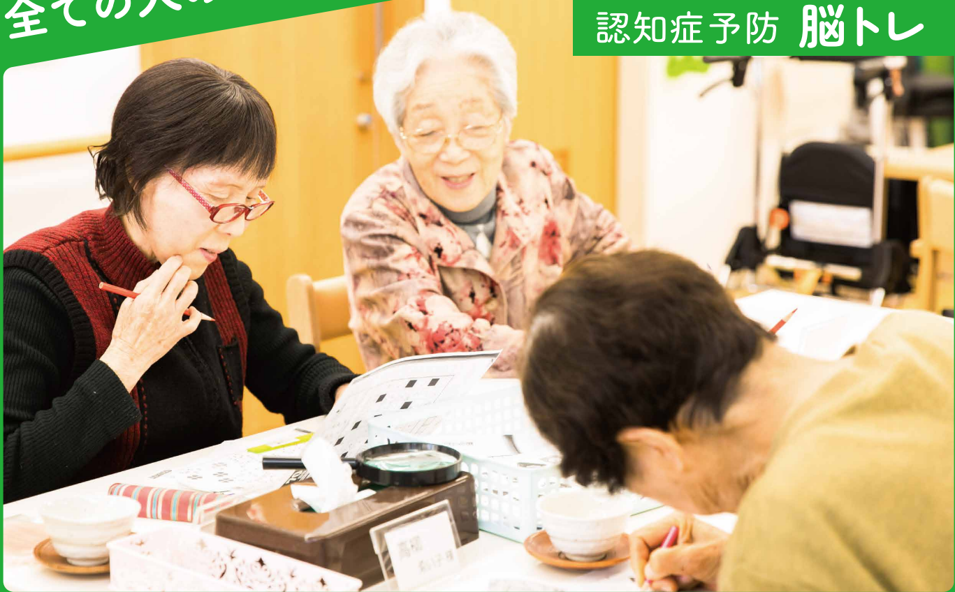
認知症予防 脳トレ