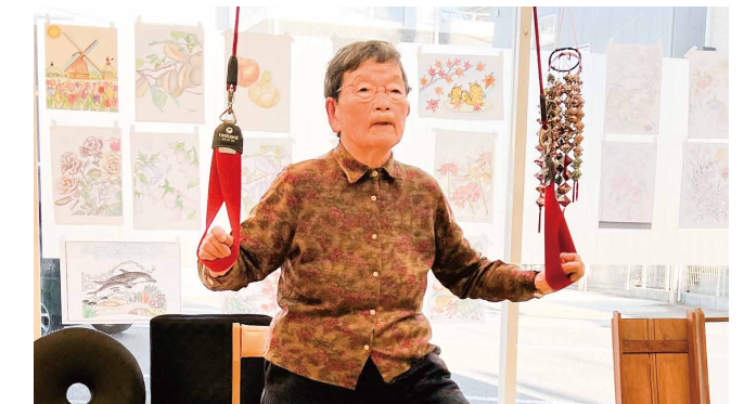
80代・女性 利用者Uさん

リハビリを続けるうちに脚の筋力がつき、歩行が安定したので、一人で東京へ行くことを決意しました。不安もありましたが、電車を4回乗り換え無事にお寺参りができました。今後も遠出できるよう、バイク運動やマシン運動、レッドコードで足腰を鍛えます！