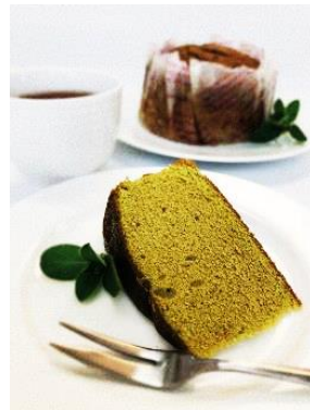
しっとりシフォン 抹茶