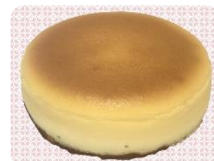
しっとり濃厚チーズケーキ