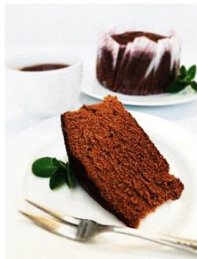
しっとりシフォン チョコ