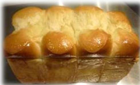
バター薫る ホテルブレッド