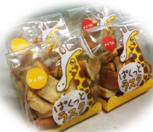
ぱくっとラスク (シュガー、メイプル)

たまごたっぷり、やさしい甘さのしっとり ぱくっと一口ケーキです。 お子様のおやつにおすすめです。