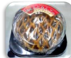
フルーツパウンド