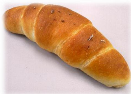
北海道産小麦の 塩パン

固定客を獲得するための看板商品を食事パン、惣菜パン、菓子パンまで幅広く取り揃えております。