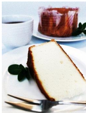
しっとりシフォン プレーン