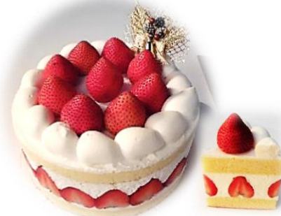
クリスマスケーキ