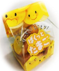
ぱくっとたまごケーキ

いろいろな味のクリームをサ ンドした、長さ34cmの長細い パン、発売40年の静岡のソウ ルフード