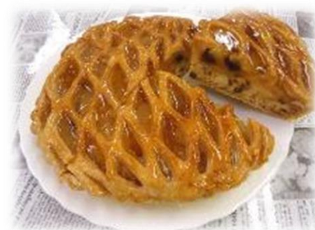
国産りんごの窯焼き アップルパイ

ほどよい酸味と甘さの国産りんごを使用し、さっくり香ばしく焼き上げたアップルパイ。