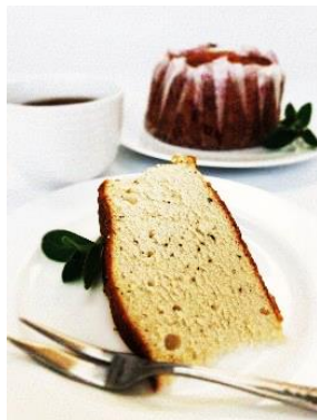
しっとりシフォン 紅茶